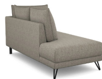
T03L 95 cm x 92 cm x 187 cm 57 kg / 1 pcs