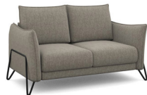
C200 161 cm x 92 cm x 96 cm 47 kg / 1 pcs