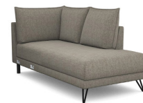
T03R 95 cm x 92 cm x 187 cm 57 kg / 1 pcs