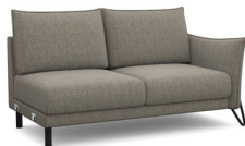
B250R 172 cm x 92 cm x 96 cm 48 kg / 1 pcs