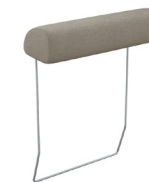
TT00 54 cm x 16/70 cm x 21 cm 5 kg / 1 pcs