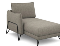
CH00L 97 cm x 92 cm x 158 cm 49 kg / 1 pcs