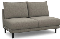
E250 155 cm x 92 cm x 96 cm 42 kg / 1 pcs