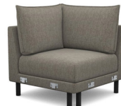
EK00 90 cm x 92 cm x 90 cm 34 kg / 1 pcs