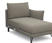
CH00R 97 cm x 92 cm x 158 cm 49 kg / 1 pcs