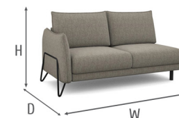
Dimensions W x H x D