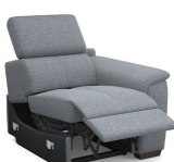
B100ER 85 cm x 79 cm x 106 cm 53 kg / 1 pcs