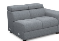
B200R 140 cm x 79 cm x 106 cm 45 kg / 1 pcs