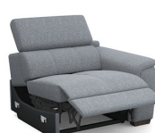
B150ER 106 cm x 79 cm x 106 cm 57 kg / 1 pcs