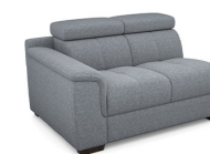
B200L 140 cm x 79 cm x 106 cm 45 kg / 1 pcs