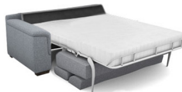
FB250LA 193 cm x 79 cm x 106 cm