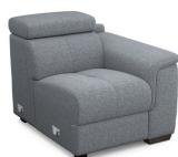
B100R 85 cm x 79 cm x 106 cm 33 kg / 1 pcs