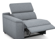
B150EL 106 cm x 79 cm x 106 cm 57 kg / 1 pcs