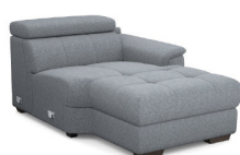
CH02R 120 cm x 79 cm x 172 cm 52 kg / 1 pcs