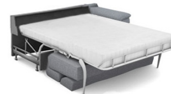
FB250RA 193 cm x 79 cm x 106 cm