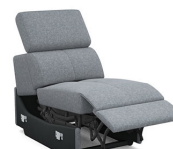
E100EL 57 cm x 79 cm x 106 cm 39 kg / 1 pcs