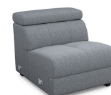
E150 79 cm x 79 cm x 106 cm 27 kg / 1 pcs