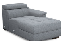
CH00R 101 cm x 79 cm x 172 cm 50 kg / 1 pcs