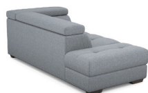
T00L 111 cm x 79 cm x 225 cm 70 kg / 1 pcs