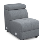
E100 57 cm x 79 cm x 106 cm 24 kg / 1 pcs