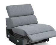
E150EL 79 cm x 79 cm x 106 cm 43 kg / 1 pcs