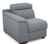
B100L 85 cm x 79 cm x 106 cm 33 kg / 1 pcs

Modules disponibles (Available modules):