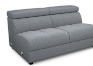
E300 156 cm x 79 cm x 106 cm 44 kg / 1 pcs