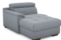
CH02L 120 cm x 79 cm x 172 cm 52 kg / 1 pcs