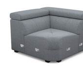
EK03 114 cm x 79 cm x 114 cm 42 kg / 1 pcs